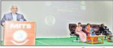
మిట్స్ కళాశాలలో జరిగిన మిట్స్ కళాశాలలో జాతీయస్థాయి హ్యాకథన్ పోటీలు విజయవంతంగా జరిగింది.

మదనపల్లి, నవంబర్ 25 (ఆంధ్ర ప్రభ): మదనపల్లి జిల్లాలోని మిట్స్ కళాశాలలో జరిగిన మిట్స్ కళాశాలలో జాతీయస్థాయి హ్యాకథన్ పోటీలు విజయవంతంగా జరిగింది. ఈ కార్యక్రమంలో విద్యార్థులు సాంకేతిక పరిష్కారాలను అభివృద్ధి చేశారు. ఈ కార్యక్రమంలో విద్యార్థులు సాంకేతిక పరిష్కారాలను అభివృద్ధి చేశారు. మిట్స్ కళాశాలలో జరిగిన మిట్స్ కళాశాలలో జాతీయస్థాయి హ్యాకథన్ పోటీలు విజయవంతంగా జరిగింది. ఈ కార్యక్రమంలో విద్యార్థులు సాంకేతిక పరిష్కారాలను అభివృద్ధి చేశారు. ఈ కార్యక్రమంలో విద్యార్థులు సాంకేతిక పరిష్కారాలను అభివృద్ధి చేశారు.